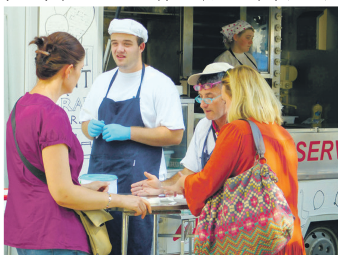
Posjetitelji su rado probali nešto novo