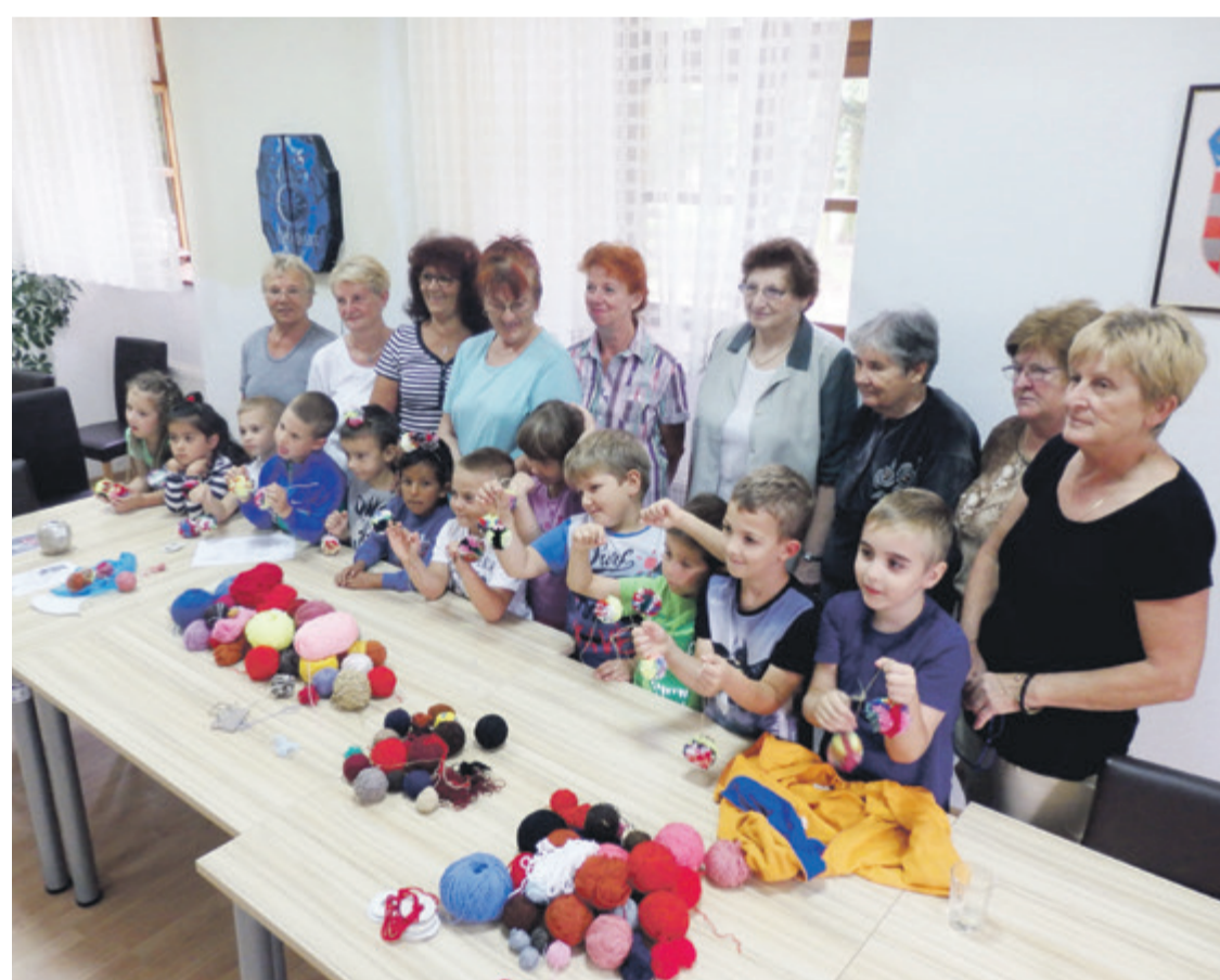
Žene iz Centra svijeta i djeca u zajedničkoj aktivnosti

Ovaj susret je ujedno i uvod u tjedan uoči obilježavanja međunarodnog Dana starijih osoba (1. listopada), kada će ovakve aktivnosti intenzivirati, a u programu će ponovo biti djeca iz „Smjehuljice“, „Iskrice“ i „Radosti“.