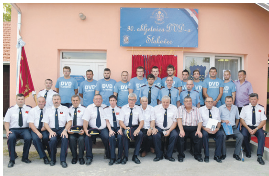
Članovi DVD-a Slokovec