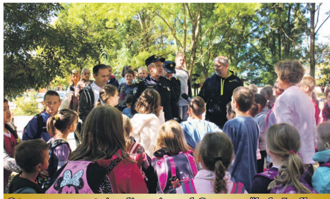
Otvoren prometni poligon ispred Osnovne škole Ludbreg

U sklopu Dječjeg tjedna otvoren je pješačko-biciklistički poligon za prometnu edukaciju djece. Poligonom su učenici dobili mogućnost učenja ponašanja u prometu, izvođenja praktičnih vježbi i svladavanja različitih prometnih situacija. Otvorenju poligona naočio je ludbreški gradonačelnik Du-bravko Bilić te predstavnici PU Varaždinske, Danijel Posavec, voditelj Odsjeka za sigurnost cestovnog prometa i Darko Dragičević, voditelj Službe policije.