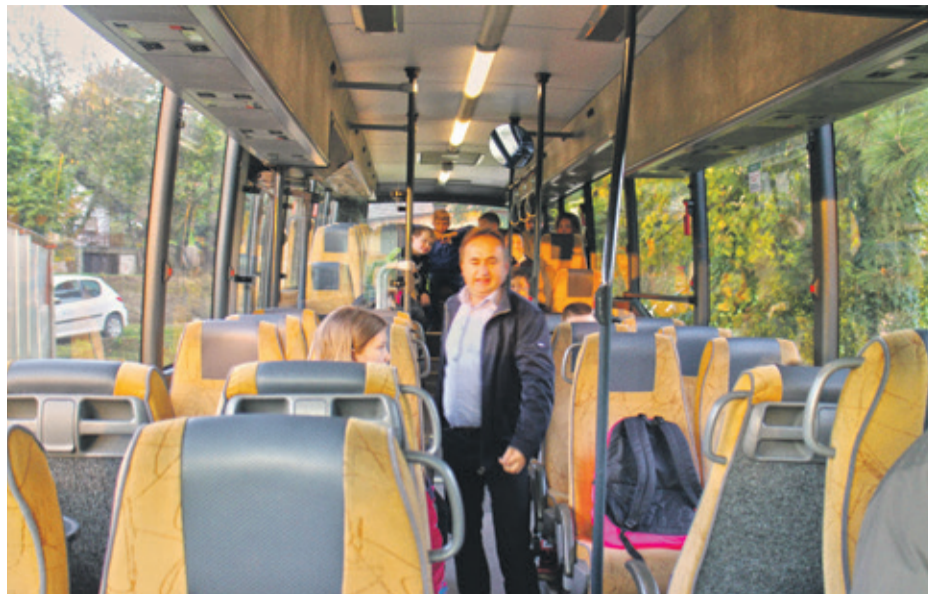
Gradonačelnik Bilić testira vožnju školskim autobusom

- Utvrdili smo u Bolfanu da je problem Školska ulica koja je preuska, a nije ni asfaltirana i to je jedan od problema koji moramo riješiti. Također, potrebno je porezati i grane da ne vise na cestu i tako zapinju o autobus. U Vinogradima Ludbreškim smo konstatairali da gotovo nijedno stajalište koje se sada koristi ne odgovara potrebama. Neka je potrebno premjestiti na drugu stranu, na drugu lokaciju. Upravo radimo prometni elaborat da vidimo koliko će to koštati i kojim redoslijedom ćemo premješati ta stajališta, a sve s ciljem sigurnosti djece jer ona su u ovom trenutku najvažnija i nadam se da ćemo to u vrlo brzom roku riješiti