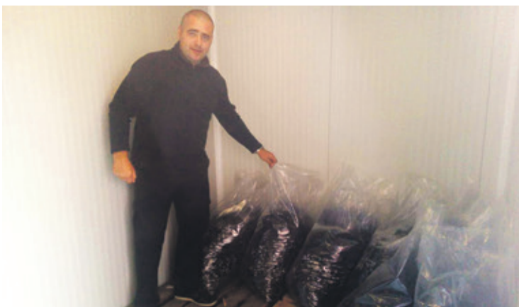
Organiziraju proizvodnju, otkupljuju i prodaju voće i povrće

Ipak, nismo očekivali ovakav veliki broj zainteresiranih poljoprivrednika što samo govori da je samo osnivanje Poljoprivredne zadruge bilo potrebno i da je Poljoprivredna zadruga na području Grada Ludbrega potrebna za sve poljoprivredne proizvođače našega kraja. – zaključuje Makar.