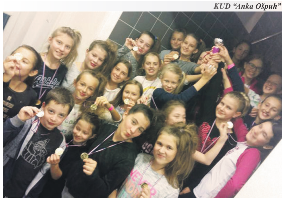
KUD „Anka Ošpuh“

Subota je bila rezervirana za razgledavanje Varaždina i sudjelovanje kratkim programom na Gospodarskom sajmu, te za večernji koncert u Ludbregu, a u nedjelju prijedpodne su uz vodiča upoznali Ludbreg te sudjelovali na misi u župnoj crkvi Presvetog Trojstva. Dva KUD-a su učvrstila novonastalo prijateljstvo pa će u kolovozu 2017. filipjanci biti domaćini ludbreškim folklorcima na višednevnoj mini turneji na Jadranu.