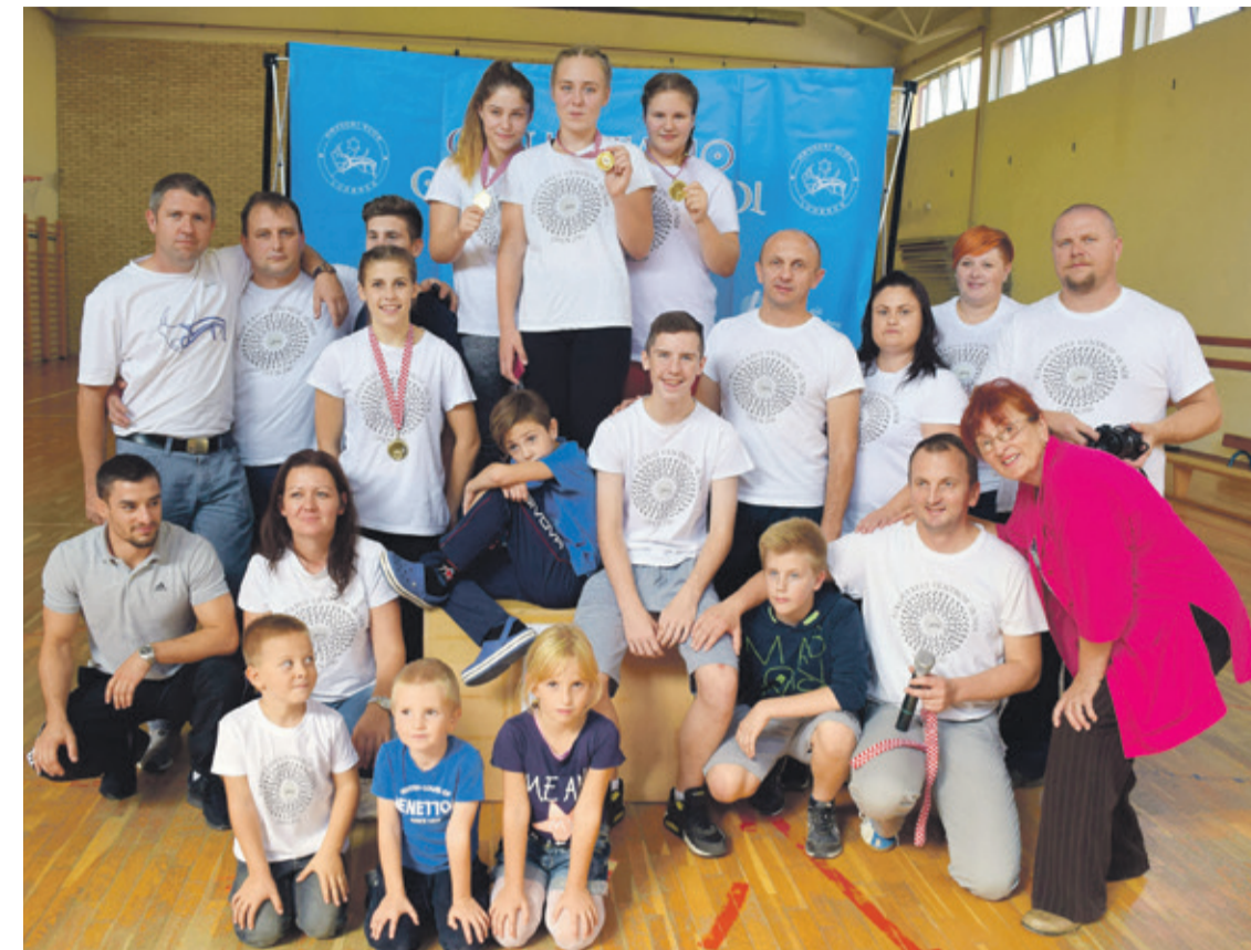
HK Ludbreg nakon prvenstva Hrvatske

U nižim kategorijama susreću su uglavnom završeni tušem nakon samo nekoliko sekundi borbe dok smo u višim kategorijama na strunjači gledali ozbiljnije borbe koje su najčešće završavale u dvije runde na bodove. Pohvale za ovaj nadasve vrijedan rezultat osim cura samih zaslužuju i njihovi roditelji, braća treneri Ignac i Krešo Horvat te svi ostali koji s velikom entuzijazmom rade u HK Ludbreg. (dv)