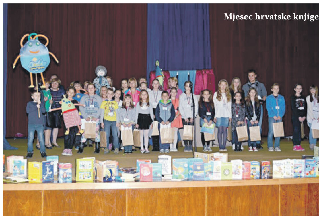
Mjesec hrvatske knjige

Mjesec hrvatske knjige je manifestacija koja se već više od dva desetljeća održava s ciljem promicanja knjige i čitanja kao društvene vrijednosti. U manifestaciji se uključila i Gradska knjižnica i čitaonica Mladen Kerstner koja je priredila brojne zanimljive programe, dok su neki tek pred nama.