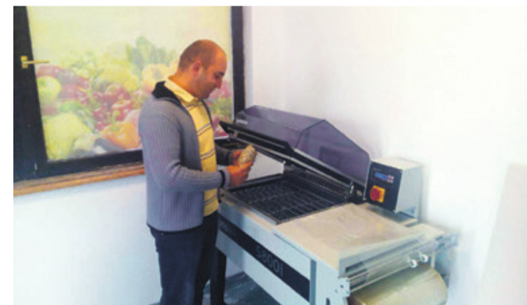
Nabavljene su nova pakirnica i hladnjača

Mnogi se udružuju bez ikakve početnog kapitala, bez ikakve opreme potrebne za uspješno početno poslovanje, a mi već na samom početku imamo pakirnicu i hladnjaču koja je nabavljena u sklopu projekta kojega je provodio Grad Ludbreg. S obzirom da smo Poljopri-