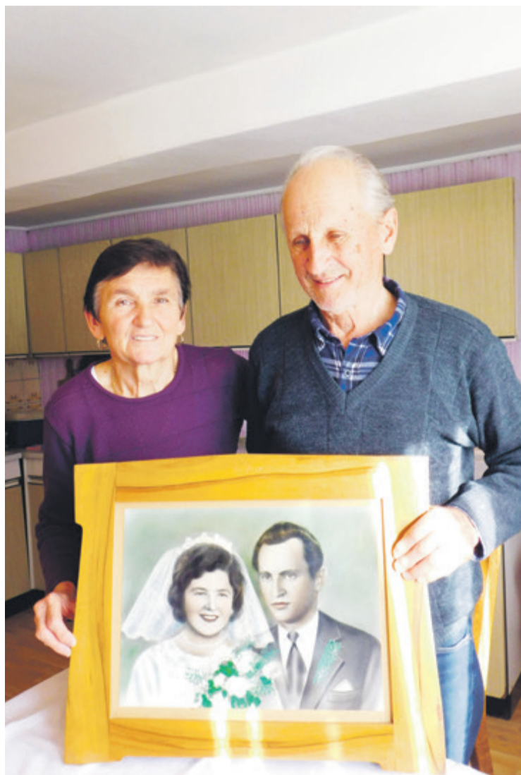
Fotografija s vjenčanja 1966. godine

Ponosni su na kćeri koje su s vremenom osnovale vlastite obitelji. Njih ništa nije vuklo