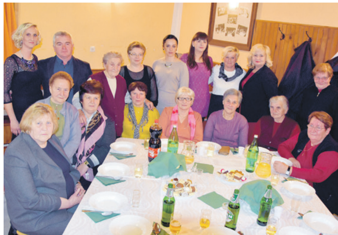
Donatorska večera udruge Margareta