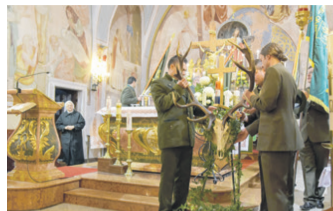
Prilikom obljetnice slavljenica je i sveta misa

Sveti Hubert rođen je u drugoj polovici 7. stoljeća u Toulouseu. Iako porijeklom iz francuske plemićke obitelji, kao strastveni lovac usudio se umetnuti križ i svijeću u sredinu jelenskih rogova. Zbog toga te zbog dokazane odanosti kršćanskoj kulturi, lovci su ga devet stoljeća kasnije uzeli za svoga zaštitnika.