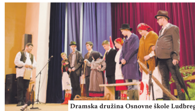
Dramska družina Osnovne škole Ludbreg