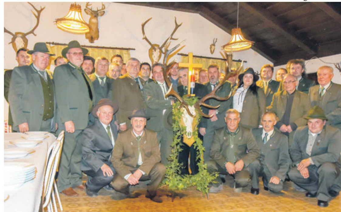
LD Srnjak proslavilo važnu obljetnicu

Ludbreški lovci su uvijek dobri domaćini svojim kolegama, ali i rado viđeni gosti u lovištima diljem Hrvatske gdje uvijek koriste priliku za promociju kraja iz kojeg dolaze. Vrijedi istaknuti da je Hrvatski lovački savez nedavno donio odluku da će 2017. godine središnja proslava Svetog Huberta biti održana u Ludbregu. Veliko je to priznanje za lovstvo Varaždinske županije i Ludbrega.(dv)