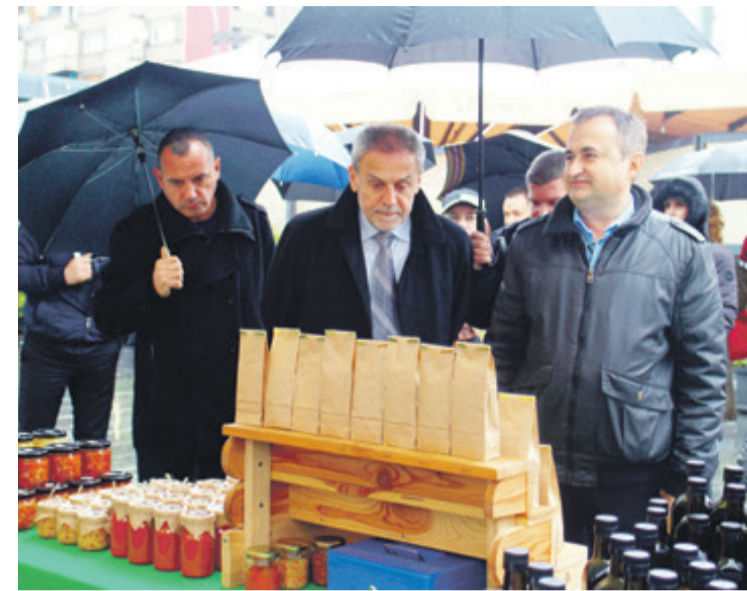
Ludbreški proizvodi na Kvatriću

Festival zdrave hrane potrajavao je tjedan dana i bio je odlična prilika svim Zagrepčanima za kupnju proizvoda rađenih po starinskim recepturama i po promotivnim cijenama.