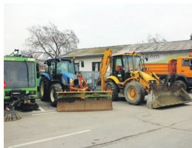
Zimski vozni park