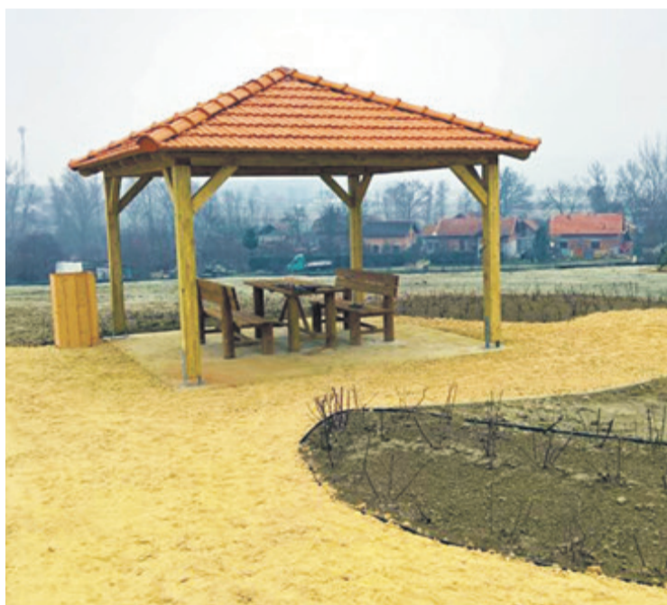
Potpuno novi izgled Meke

Stoga pozivam sve stanovnike da nam se pridruže u ponedjeljak na lokaciji koja je u svega par mjeseci od potencijalne ekološke katastrofe postala zeleni pojas našega grada. - poručio je ludbreški gradonačelnik.