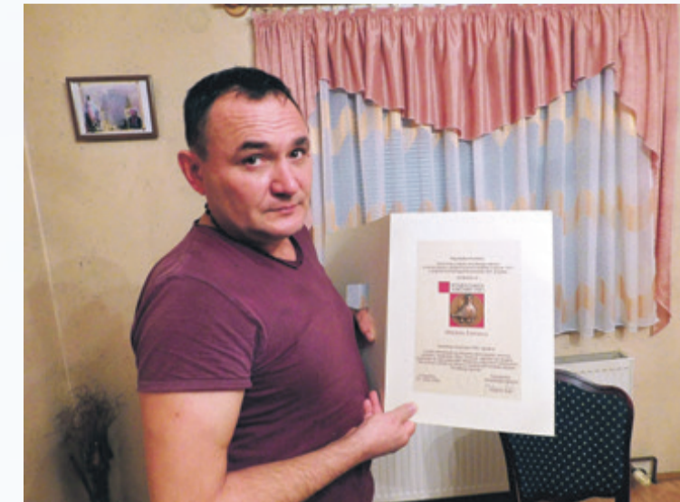
Mladenovo najdraže priznanje je Spomen plaketa Grada Vukovara

Na hipodromu, ispred papamobila s papom Ivanom Pavlom II.