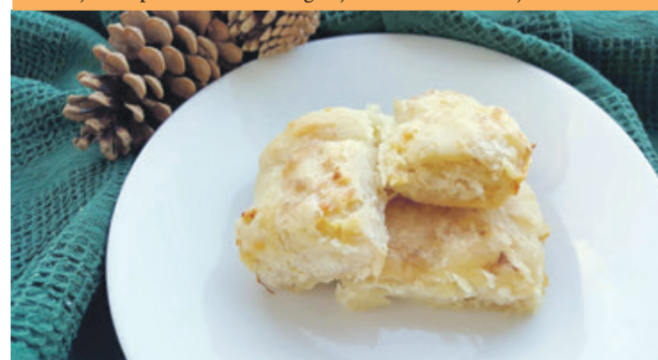
Štrukli s repom i sirom

Ovim nadjevom iznenadit ćete svoju obitelj, ali i goste, nadasve one koji žele probati nešto drugačije od klasičnih nadjeva.