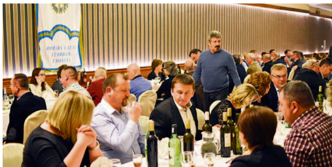
Večer zlatnih vina okupila brojne posjetitelje

Fond za nagrađivanje izvrsnosti Rotary kluba Ludbreg radi nagrađivanja najboljih srednjoškolaca i studenata sa područja grada Ludbrega i općina Martijanec, Sveti Đurd, Mali Bukovec i Veliki Bukovec, na temelju odredbi članka 9. stavka 1. Pravilnika o ustrojavanju i djelovanju Fonda za nagrađivanje izvrsnosti Rotary kluba Ludbreg, raspisuje: