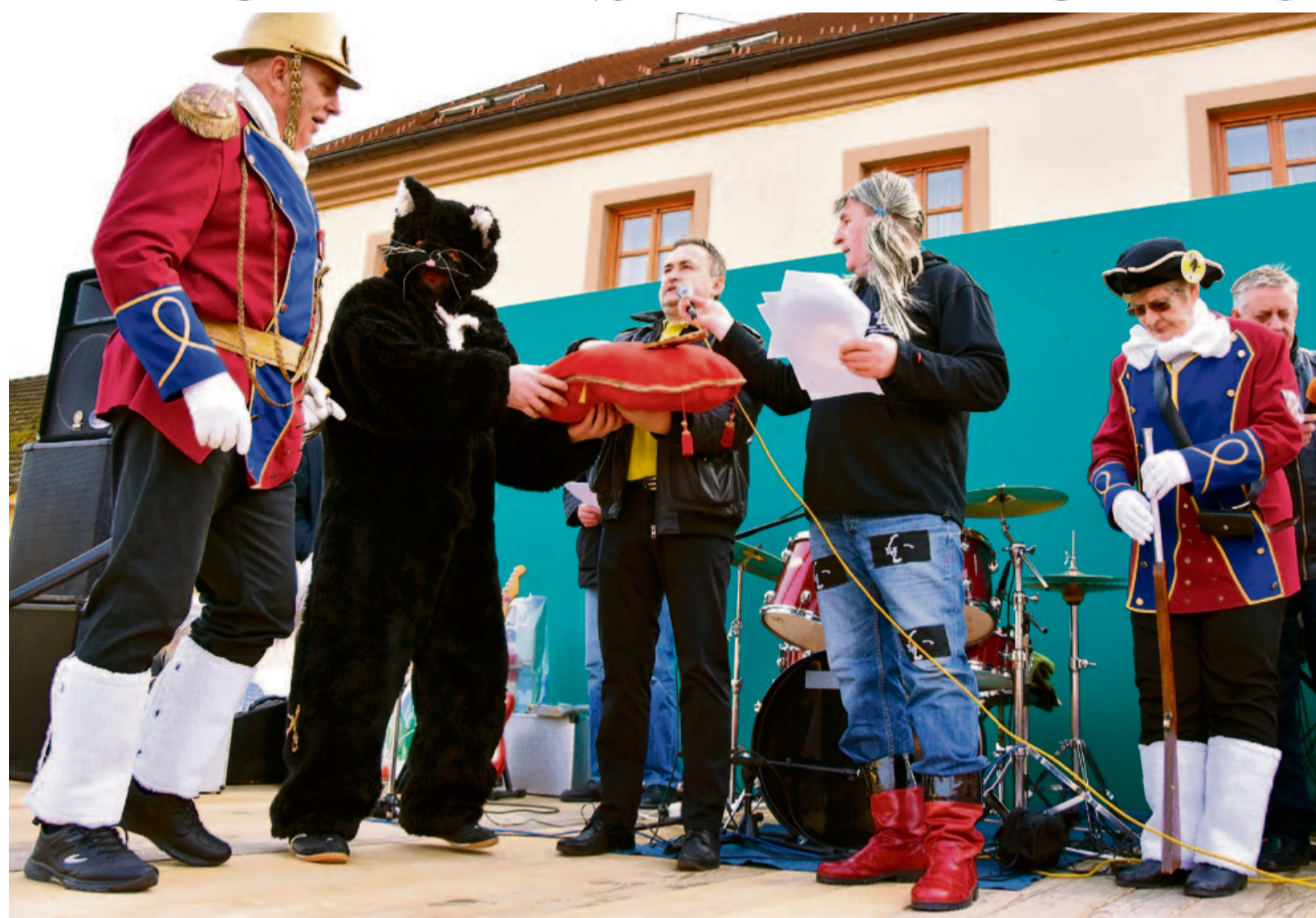
"Uzimamo ključeve grada da sve dobro kaj ste napravili, pokvarimo"

Nezaobilazan sadržaj i ove je godine bilo čitanje popularnog "Vrapca", a pronađen je i krivac za sve zlo i nedaće koji je po zasluzenoj kazni i spaljen. Ovogodišnji Fašnjak u Centru svijeta održan je u organizaciji Udruge "Črni maček ludbreški" dok su pokrovitelji manifestacije bili Grad Ludbreg, Turistička zajednica grada Ludbrega i Centar za kulturu.