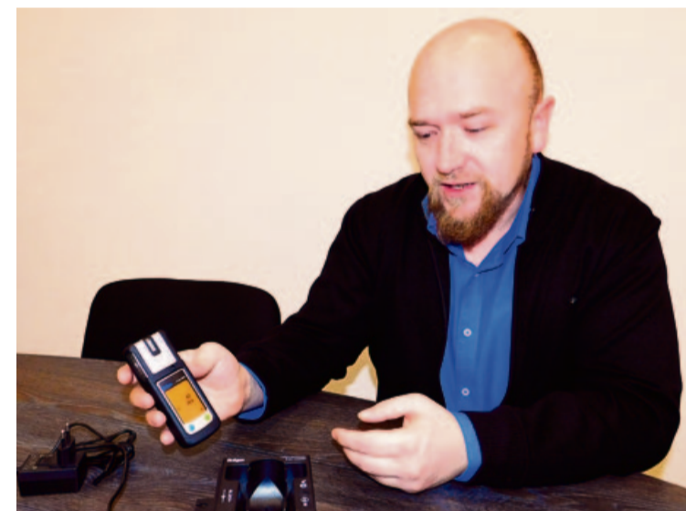
Uređaj za mjerenje plinova