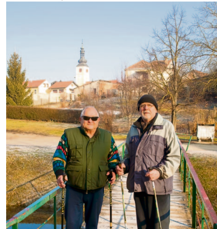
Nordijsko hodanje sve popularnije