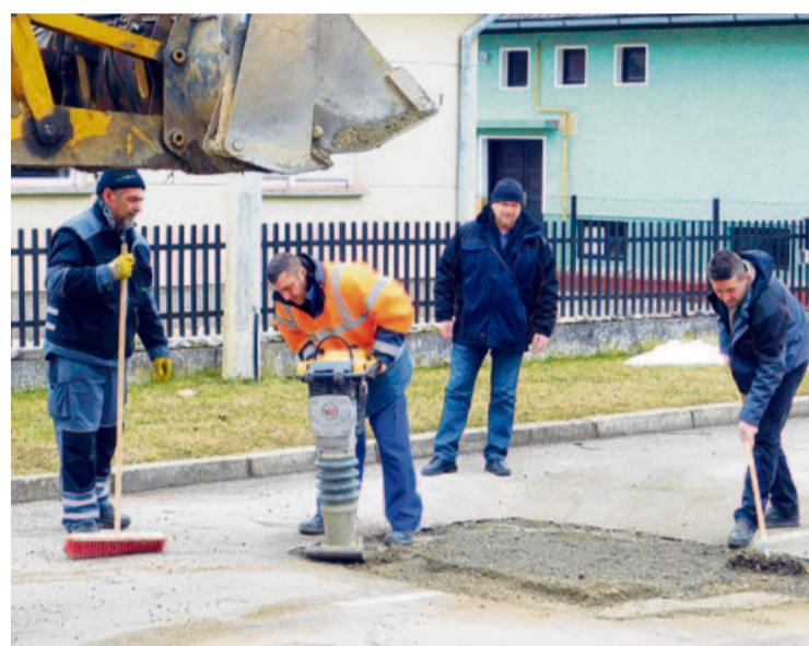
Sanacija u Nemčićevoj

Poslovni objekt od oko 70 kvadrata u potpunosti je preuređen i obnovljen od temelja do krovovišta, s kompletnom novom vanjskom i unutarnjom stolarijom, termo-fasadom, postavljene su nove instalaci-