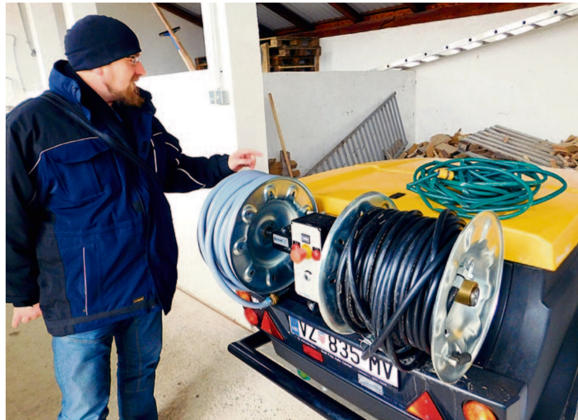
Flex Jet namijenjen za čišćenje sustava javne kanalizacije

Nedugo nakon što je kupljeno, novo specijalno vozilo za čišćenje sustava javne kanalizacije ubrzo je imalo prve intervencije na čišćenju kanalizacije u Ulici Nikole Tesle i u Nazorovoj ulici u Selniku.