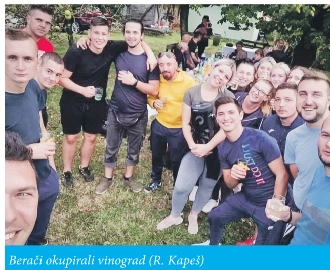
Berači okupirali vinograd (R. Kapeš)