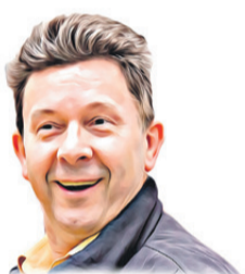
Piše: Aleksandar Horvat