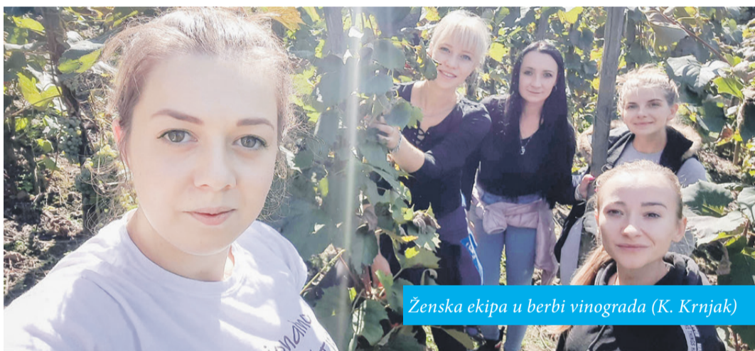
Ženska ekipa u berbi vinograda (K. Krnjak)