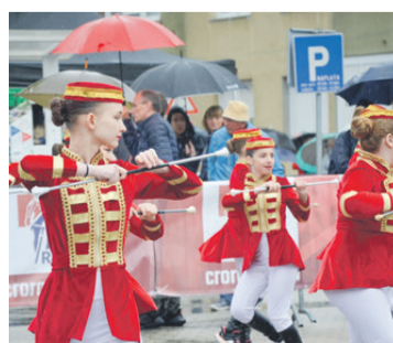
Publiku su prilikom iščekivanja biciklista zabavljale Ludbreške majoretkinje i Twirling klub Ludbreg