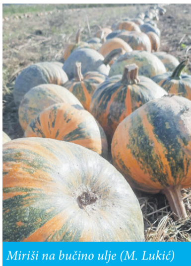
Miriši na bučino ulje (M. Lukić)