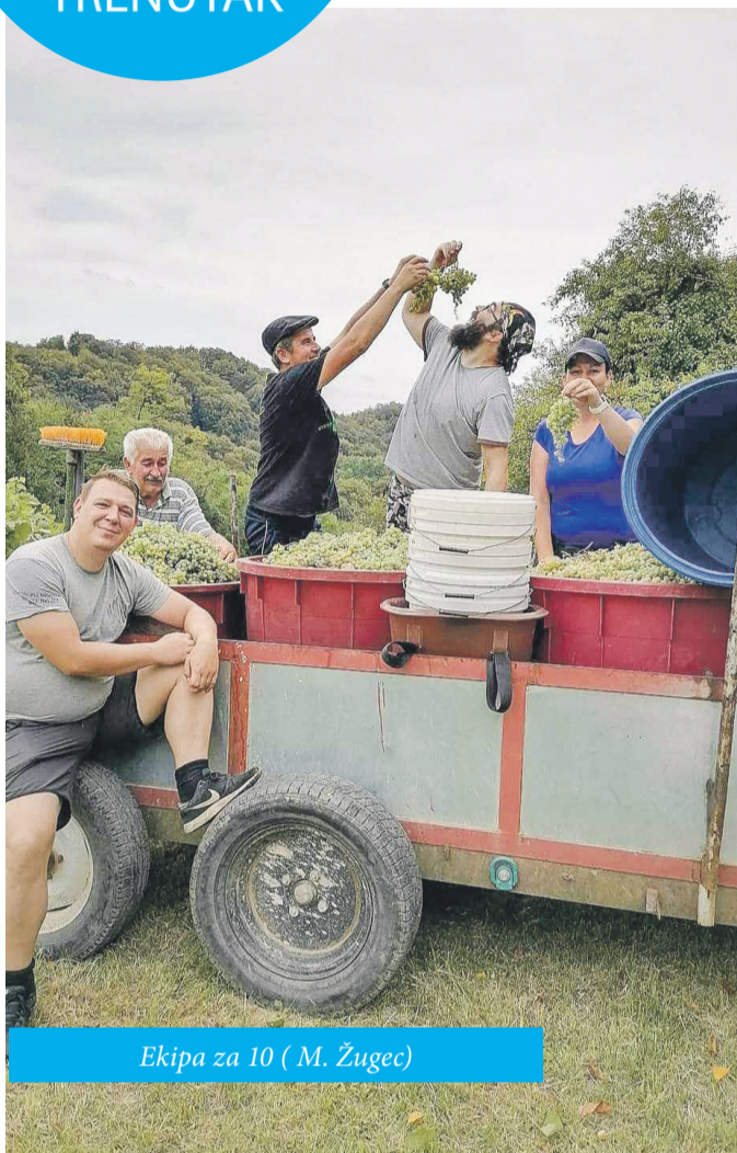
Ekipa za 10 ( M. Žugec)

Dragi čitatelji Ludbreških novina, od kolovoza smo u naše novine uveli novu/staru rubriku – VAŠ FOTO TRENUTAK! Za sadržaj rubrike zaslužni ste upravo Vi. Naš zadatak je odabrati temu, a vaš zadatak je okinuti fotku. Protekli mjesec bio je obilježen berbama, stoga smo vas zamolili da nam šaljete fotografije vas i vaše ekipe u berbi. U nastavku pogledajte što smo prikupili. Tema za idući mjesec je - KESTENIJADA. Fotografije nam šaljete na e-mail: ludbreske-novine@czkidn.hr do 25. u mjesecu, a najbolje objavljujemo u idućem broju Ludbreških novina.