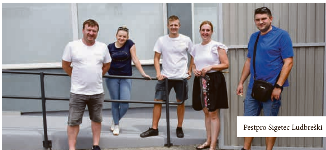
Pestpro Sigetec Ludbreški