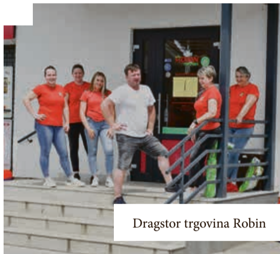
Dragstor trgovina Robin