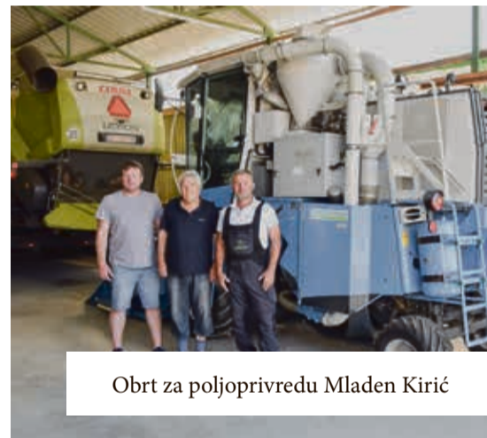
Obrt za poljoprivredu Mladen Kirić