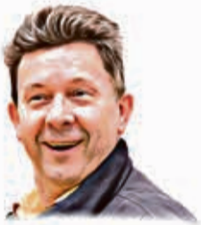
Piše: Aleksandar Horvat

Došli smo v jeno interesantno doba. Tehnika, digitalizacija, moderna civilizacija. Počel sam o tomu misliti od kak nas v zadnje vreme deždi pereju, i to nekak čudno. Ne onak kak lani, dok je pomali curelo i curelo, pak se ne moglo nacureti. Vezda sako malo dojde nekakva "superčelija", nevihta zapakerana v mali škrneclin. Dojde i besni kak da je smak sveta, a dale sučano i toplo. Mi vezda imamo tehniku kaj moremo na radaru videti gde i kak curi, i kam to se ide. Stvar je super, jako napredna i kak se to veli "sofisticerana" (to dojde od reči mudrost ). Kompjuteri računaju kak bu i gde curelo i kakvo bu vreme opčenito. Ne bum se z tem vezda zamaryl jer očem reči da od te tehnike je jedina korist kaj v napri vidite jel vam bu toča nekaj potokla ili ne bu.