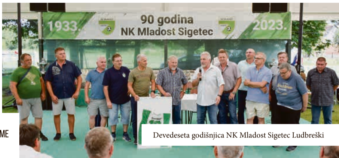
Devedeseta godišnjica NK Mladost Sigetec Ludbreški