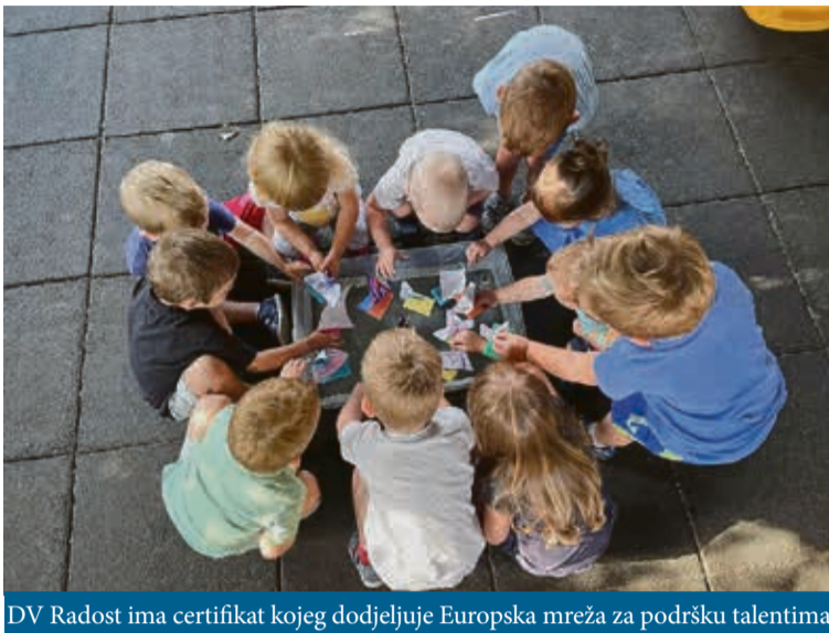
DV Radost ima certifikat kojeg dodjeljuje Europska mreža za podršku talentima

Mi smo tako postali jedan od kandidata za razvoj takvog centra, a temelj za to bile su prethodno odrađene edukacije na nizozemskom sveučilištu. Psihologinja i ja prošle smo godinu dana edukacija za rad s darovitom djecom gdje smo dobile više teorije, a manje prakse. Po-