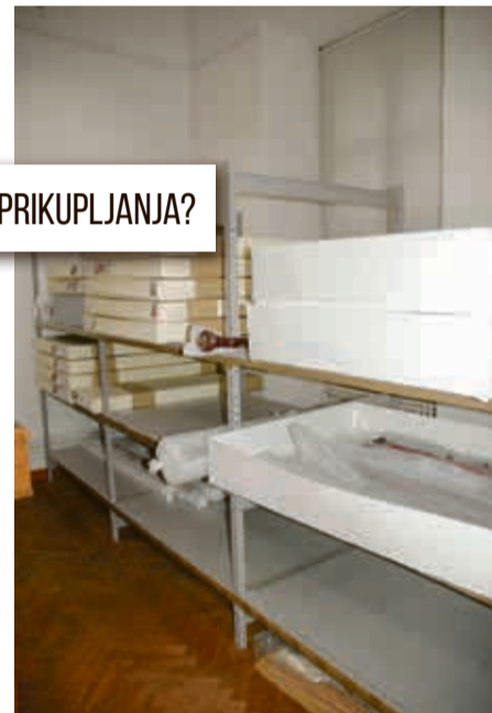
Zastava u ladičaru