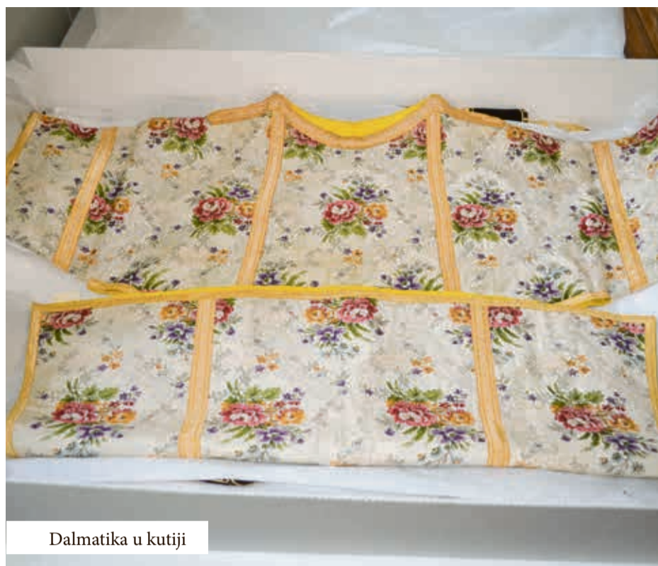
Dalmatika u kutiji

U Restauratorskom centru Ludbreg 2010. godine uspostavljena je prva službena Tekstiloteka u Hrvatskoj. Riječ je o zbirci vrijednih, ali ugroženih predmeta liturgijskog tekstila koji se čuvaju u prikladnim uvjetima s ciljem zaštite od propadanja. Prikupljena građa bi trebala postati temelj za budući muzej tekstila.