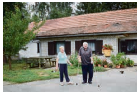
▼ Problem su neasfaltirane ceste, pa neki stanovnici do svojih kuća moraju težim putem