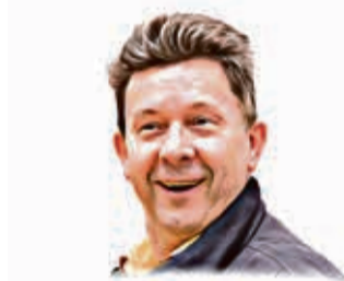
Piše: Aleksandar Horvat

Došlo je pak ono vreme dok se mejaši spominaju ko ima većega cukora. Jeni ga imaju v krvi, drugi v grozdju, treći v kleti. Kaj bu ze sega zišlo, bumo vidli, a moralo bi ziti dobro, kajti v našem kraju ima već retko koga koji se ne razme vu svete goričke meštrije, od prvoga frezanja do zadnjega pretoka. Ali, da je navek tak bilo - bormeš neje. Nemrem povedati se, ali znam ono čega se zmislim, kaj sam videl i kaj sam čul.