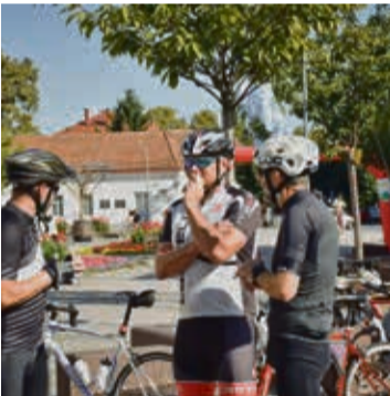
Vremensko ograničenje za završetak biciklijade bilo je 8 sati

a biciklirali su i sami članovi BSV-a Ludbreg koji nisu morali sudjelovati u organizacijskim poslovima. Ovaj sportski događaj zapravo je biciklističko druženje koje započinje u Ludbregu, a biciklisti prolaze Križevcima, Kalnikom i Varaždinskim Toplicama pa se ponovno vraćaju na Trg Svetog Trojstva. Tamo je bila organizirana vanjska zabava uz akustik svirku Civilizacija benda iz Preloga. Za najmlađe sudionike biciklijade bile su osigurane igre panelnog tipa koje su mogli igrati o odrasli kao npr. nabacivanje karika naštapiće. Osim toga, u suradnji s Policijskom postajom Ludbreg i Autoklubom Ludbreg, za mlade bicikliste pripremljen je poligon spretnosti. Radujemo se CH Bicu i sljedeće godine jer organizatori će sasvim sigurno osmisliti još ponešto novog jer baš sljedeće godine CH Bic bilježi prvi mali jubilej. Piše: Dražen Vadunec