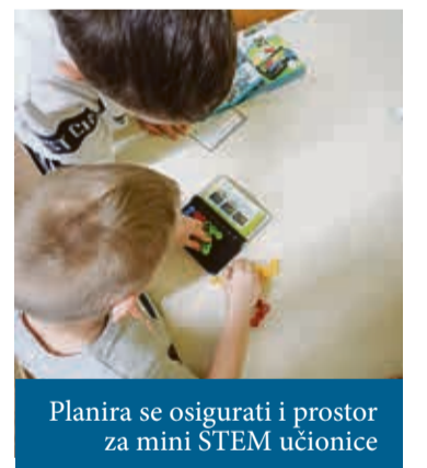
Planira se osigurati i prostor za mini STEM učionice

Obrazovanje je posebno važna komponenta budućnosti svakog grada. Temelj na kojem počiva svako obrazovanje je predškolski odgoj i prema raspodjeli poslova u Hrvatskoj taj posao je u nadležnosti gradova i općina. Prije nekog vremena smo završili projekt dogradnje našeg gradskog vrtića, ali prošle smo godine prijavili i dobili novi EU projekt treće faze uređenja vrtića čime ga proširujemo i time simbolično poručujemo da su djeca naša budućnost. Pored toga našim tetama u vrtićima osigurali smo najbolje uvjete za rad, a to nam se vraća i certificiranjem Dječjeg vrtića Radost kao vrtića koji prepoznaje darovitost u djece i od samih početaka ju usmjerava u pravom smjeru - objašnjava gradonačelnik Dubravko Bilić.