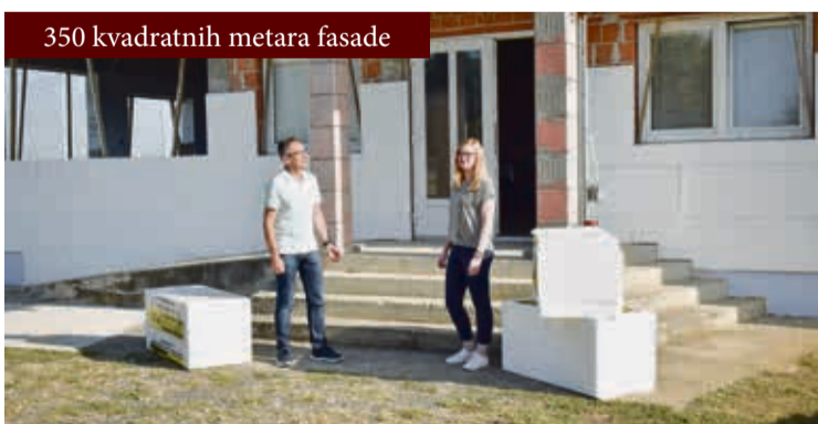
350 kvadratnih metara fasade