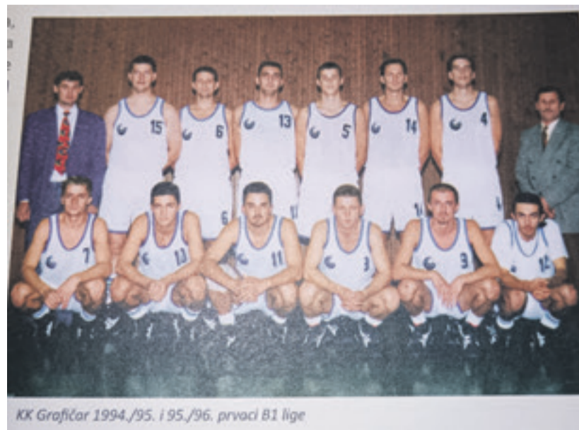
KK Grafičar 1994./95. i 95./96. prvaci B1 lige

Sigurni smo da u Ludbregu postoje ljudi koji su ove uspjehe pratili iz prve ruke, pa i aktivno sudjelovali u njima.